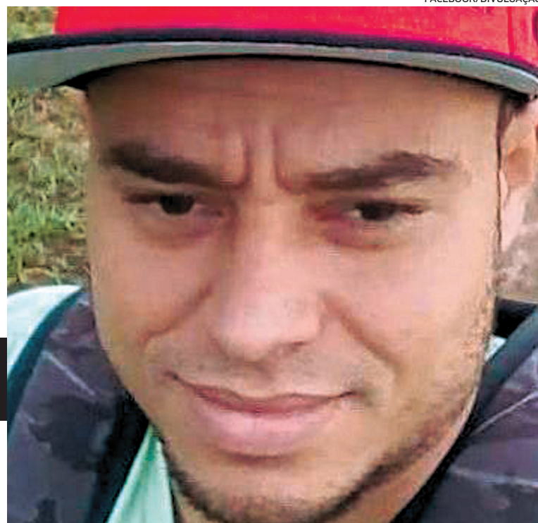
■ Família disse que poderá se despedir de Dias hoje, na igreja em São Bartolomeu

☀ Homem de 32 anos sobreviveu ao desastre de Mariana, em 2015, mas morreu no rompimento da barragem de Córrego de Feijão